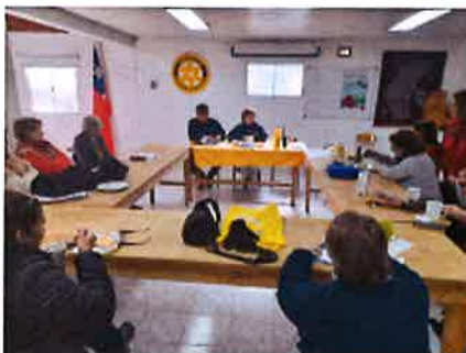
REUNION JUNTO A LA COMUNIDAD Y ORGANIZACIONES SOCIALES