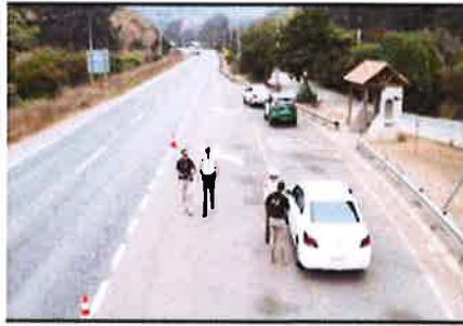
OPERATIVO DE CONTROL DE TRANSITO JUNTO A PERSONAL DE SEGURIDAD MUNICIPAL